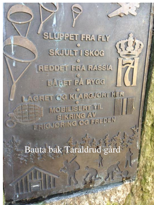
Bauta bak Taraldrud gård

Arild og Wiggo Widerøe startet Norges første flyrute fra Ingierstrand i 1934, og selv om Oppegård slapp heldig fra 2. verdenskrig, så var det mange modige kvinner og menn som risikerte livet på Taraldrud og lenger ute i skogen, med å skjule flyktninger, sabotører, våpen m.m. De loset flyktningene til Sverige via Timianruta, mens Jan Baalsrud risikerte livet i Toftefjord i Troms. Hans flukthistorie ble til en Oscar-nominert spillefilm. Dessverre ble nesten alle jødene i Oppegård innbrakt av det lokale politiet i november 1942 og sendt til dødsleirene i Tyskland med ms «Donau». Ingen overlevde.