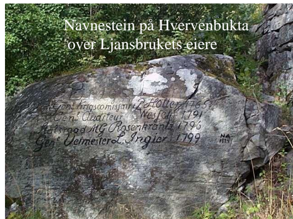
Navnestein på Hvervenbukta over Ljansbrukets eiere